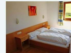
Ein mögliches 2er Zimmer.