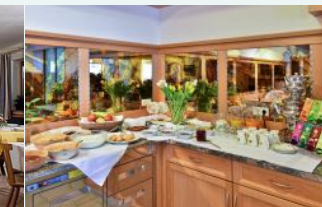
So könnte unser mögliches Frühstücksbuffet aussehen.