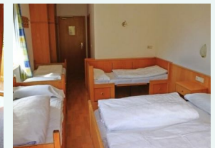
Ein mögliches 5er Zimmer.