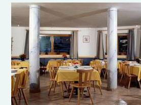
Hier werden wir gemeinsam Essen.